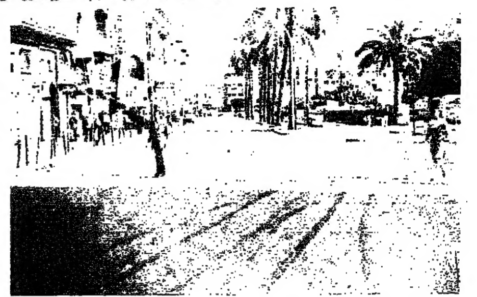
■ ساحة الشهداء .. محلات ومقاهي تواجدها محدود للمواطنين ■